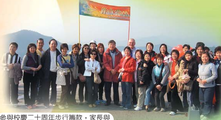
參與校慶二十周年步行籌款，家長與薛校監丘校長攝於開步禮前。