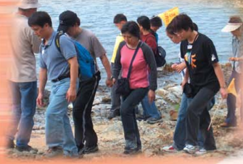
體會千年岩層在我腳下的感覺。