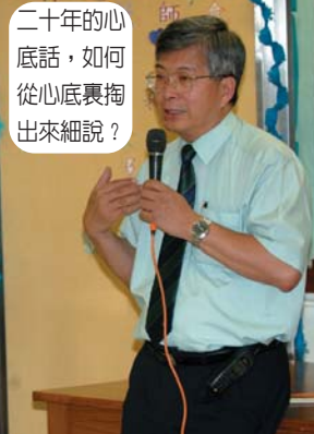
二十年的心底話，如何從心底裏掏出來細說？