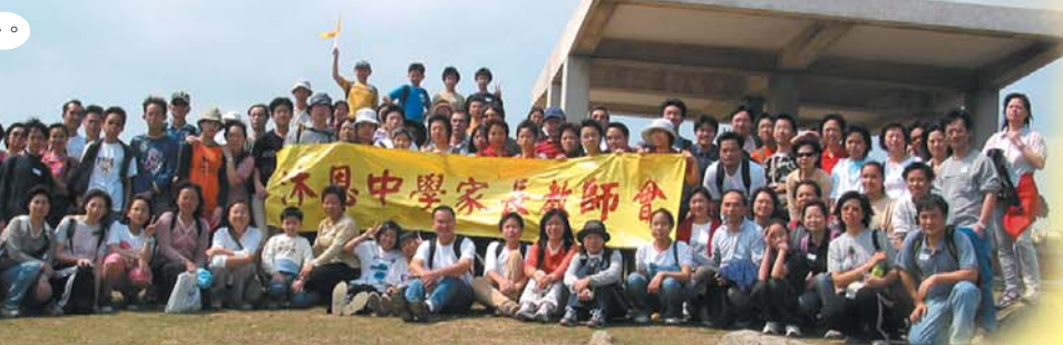
歸程了，先來一幀大合照於天地間。