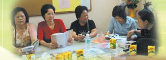
家長讀書會活動，在本會資源中心舉行。