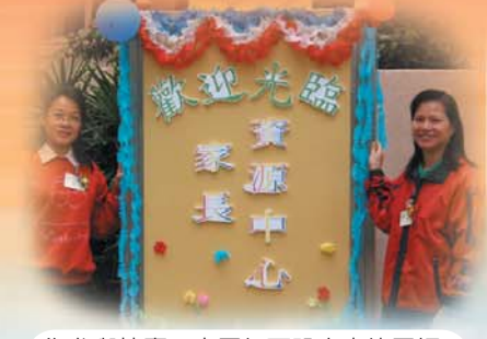
為參與校慶二十周年而設之宣傳展板。