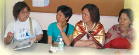
投入地分享和耐心地聆聽。