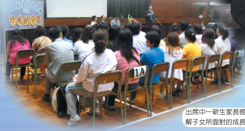
出席中一新生家長晚會，有助了解子女所面對的成長新階段。