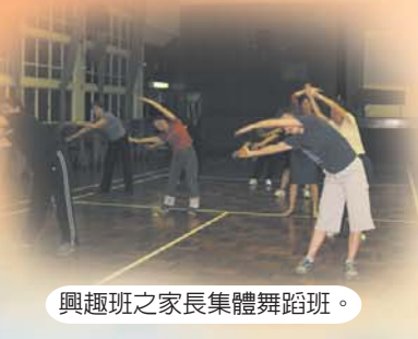
興趣班之家長集體舞蹈班。