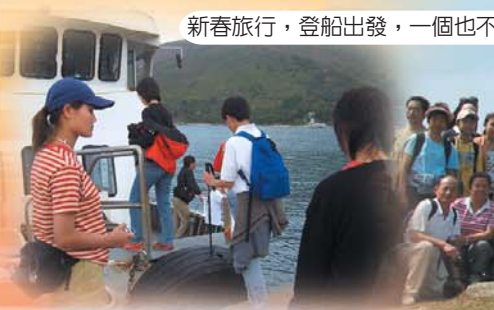
新春旅行，登船出發，一個也不能少。