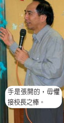
手是張開的，毋懼接校長之棒。