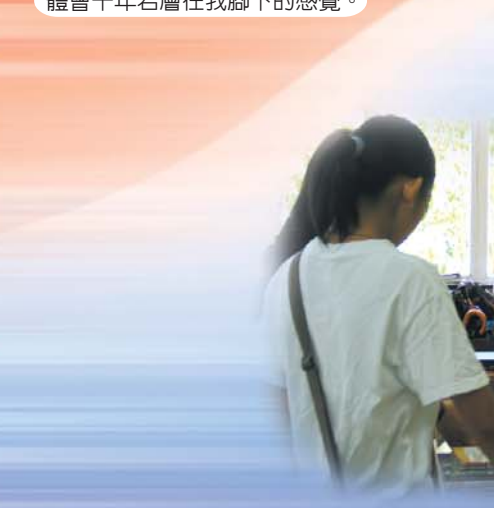
舊課本買賣很重要的一刻。