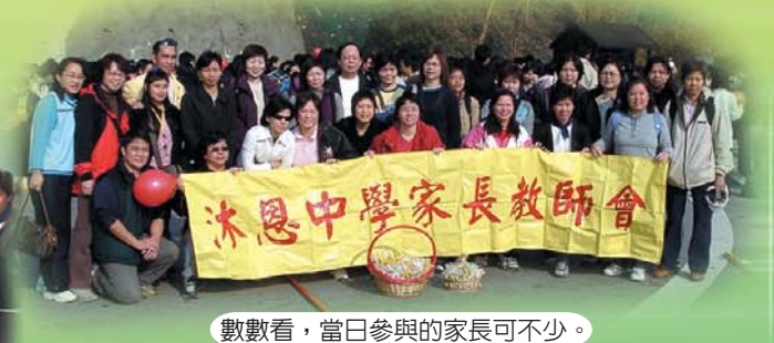
數數看，當日參與的家長可不少。