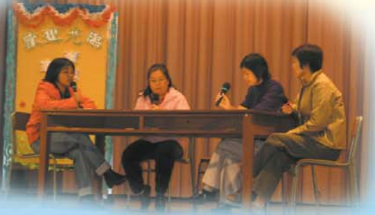
勇敢、具創意、有協作精神的家長在學校周會上演出話劇，向同學介紹家教會。