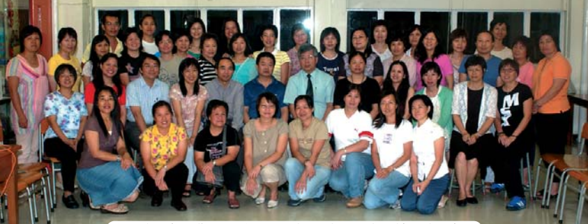
合照後，各分散。但誰不心裏烙印沐恩的人、情、事、物？