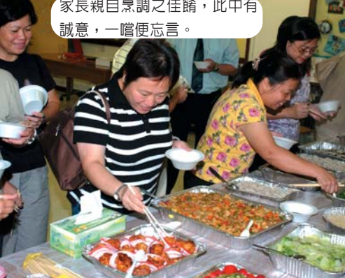
家長親自烹調之佳餚，此中有誠意，一嚐便忘言。