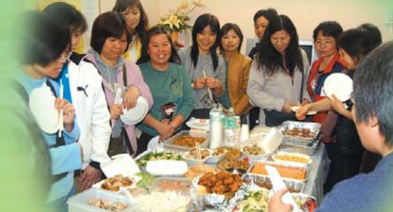
當義工之樂，得之心而寓之於美食。