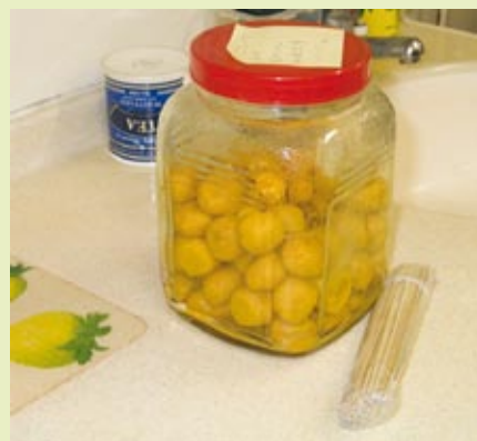
■ 溫情可以是親手研製的咖哩魚蛋和放在旁邊的竹籤

雖然一星期三晚，但是有支持點的。自知不足的仍多，但豐足的是聯於元首基督的愛的繫繩，源自那無佳形美容的上主。 知不足老師