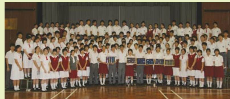
■ 來自學校不同部門的學生領袖就職典禮