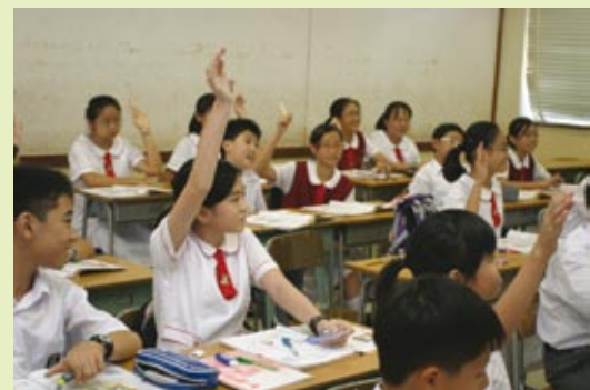
■ 中一級同學上課情況