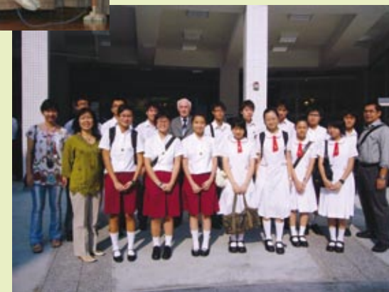
■ 同學參與由英國文化協會 舉辦之「學生聲音論壇」