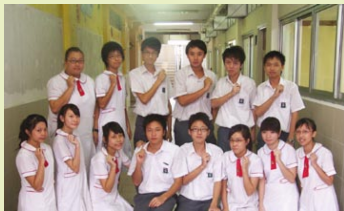
■ SOUL 候選內閣