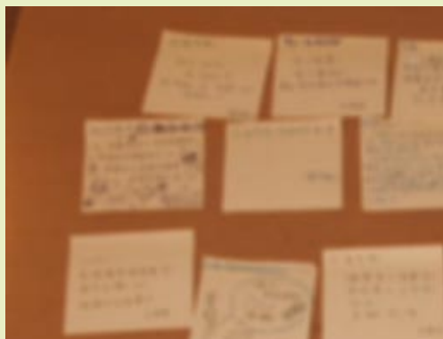
■ 溫情可以是學生在轉堂間老師還沒進來，把42張祝福的黃色紙貼滿整張教師桌（那是去年的5E）