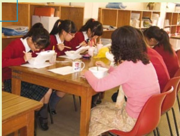
■ 溫情可以是師生一起吃飯盒