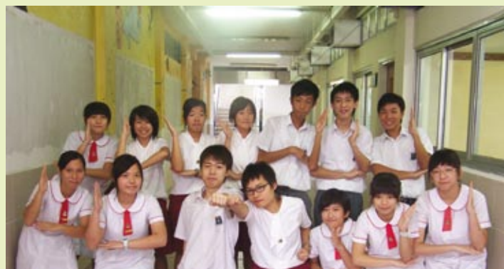
■ HERO 候選內閣