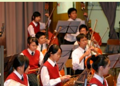
■ 同學在家教會大會上展示不同的多元學習成果