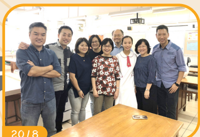
沐恩兩代人，父親(校友) 女兒(學生)同聚家政室