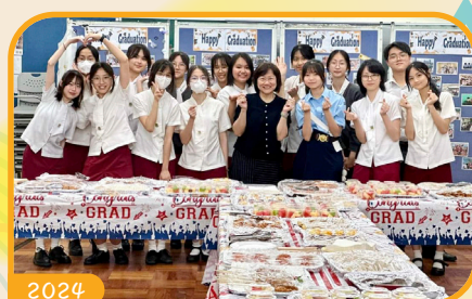
與同學預備畢業禮茶點