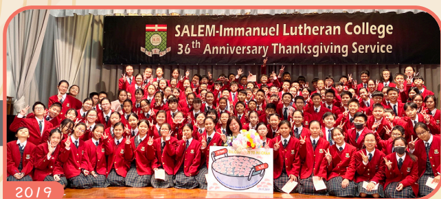
服務35年，中一學生上台獻花