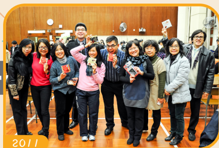
教師聖誕聯歡晚會